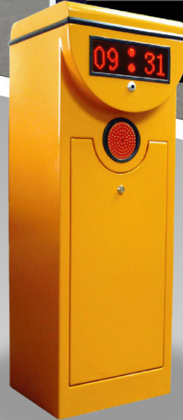
CMPC001 LED carpark Straight Boom, 3s, 4.5m