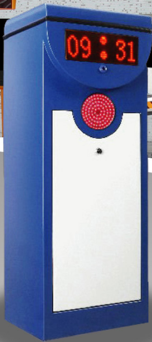
CMP5113 LED carpark Straight Boom, 4m